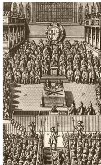
Национальный суд над Карлом I (слева; английская гравюра XVII в.) и Людовиком XVI (справа; гравюра Ф. Вендрамини, начало XIX в.)