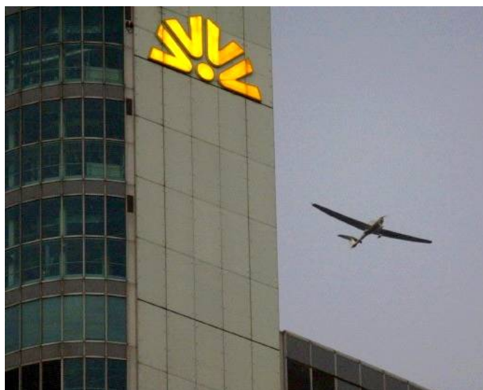
Слева — 3 января 2005 г.: небольшой самолет летчика-любителя над банковским кварталом Франкфурта-на-Майне. Справа — Федеральный Конституционный суд ФРГ выносит решение по поводу закона о воздушной безопасности.