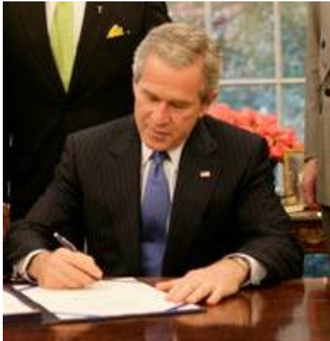
2008 г.: президент Дж. Буш накладывает вето на законопроект, запрещающий ЦРУ применять пытки при допросе подозреваемых в террористической деятельности.

Именно терроризм приводит к тому, что законодательство ограничивает права человека, в том числе основные права и свободы. Сюда относятся положения об облегченной процедуре прослушивания телефонов в целях предотвращения терактов и прочие ограничения. Некоторые общественные деятели в США после покушения на Всемирный торговый центр даже потребовали возвращение к пыткам в отношении лиц, которые подозреваются в подготовке террористических актов, чтобы получить от них сведения, которые позволили бы предотвратить данную опасность. Ведь, по Конституции, пытки запрещены и в США как нарушающие основные права человека и гражданина. Американские спецслужбы, однако, практиковали их за пределами территории США, чем вызывали скандал не только в самой Америке, но и во всем демократическом мире. Американский закон, который запретил бы представителям ЦРУ применение пыток, не вступил в силу, так как президент Дж. Буш наложил на него вето.