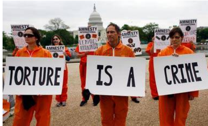
Пикет у Белого дома в знак протеста против применения ЦРУ пыток в период обсуждения возможности их легализации.