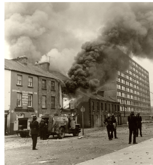
Пожар в результате взрыва бомбы. Белфаст, 1969.

Иначе говоря, это политика устрашения, подавление политических соперников насильственными мерами. В юриспруденции происходит уточнение данного понятия и «терроризм означает насилие или угрозу его применения в отношении физических лиц или организаций, а также уничтожение (повреждение) или угроза уничтожения (повреждения) имущества и других материальных объектов, создающие опасность гибели людей, причинения значительного имущественного ущерба либо наступления иных общественно опасных последствий, осуществляемые в целях нарушения общественной безопасности, устрашения населения или оказания воздействия на принятие органами власти решений, выгодных тер-