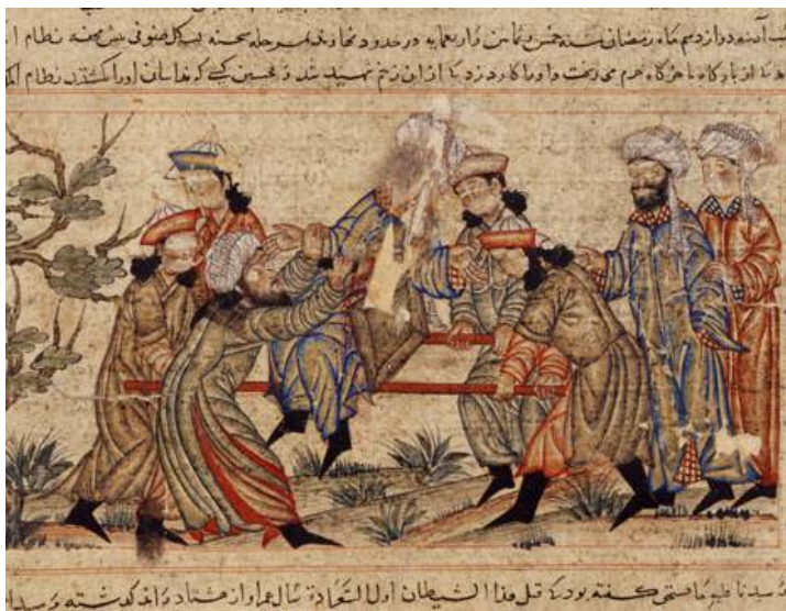
Агент ордена ассасинов (слева, в белой чалме) смертельно ранит Низам аль-Мульк, визиря на службе у сельджукских султанов. Иллюстрированная рукопись XIV в.

Внутренние и международные формы террора имеют одну и ту же сущность (устрашение противника посредством применения насилия), но, вместе с тем, отличаются по некоторым признакам. Терроризм — это не самоцель, а всегда средство борьбы. Он — одна из самых простых форм вооруженной борьбы. И в этом смысле готовность принимать данную форму борьбы можно всегда наблюдать у радикально настроенных представителей тех или иных интересов.