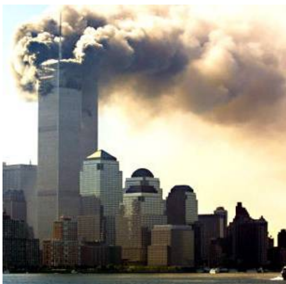
11 сентября 2001 г.: здания Всемирного торгового центра в Нью-Йорке после атаки террористов.

Закон о воздушной безопасности прошел все этапы, предусмотренные немецкой законодательной процедурой. Следует, однако, отметить, что у Федерального президента Германии возникли некоторые сомнения в правильности и приемлемости данного закона, в его совместимости с правом на жизнь, которое гарантируется Конституцией Германии. Несмотря на это, Президент, в конце концов, подписал данный закон, но рекомендовал проверить его Конституционному суду.