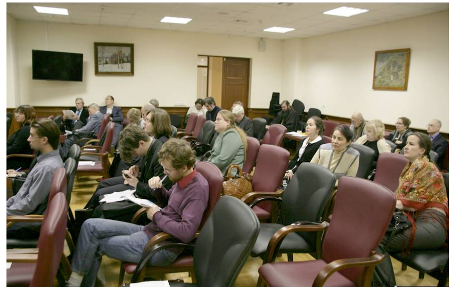
XII Панаринские чтения «Цивилизационный контекст и экспертное обеспечение государственной политики России» 20 ноября 2014 г., Философский факультет МГУ имени М.В. Ломоносова

Наиболее продуктивный этап его работы пришелся именно на тот период, когда в «постсоветской» России только начинался процесс формирования и институционализации политических наук. Этот процесс и сегодня идет с большим трудом: чрезвычайно велика инерция эпохи, для которой были характерны полное слияние политической теории и политической идеологии, находившейся вне конкуренции на «внутреннем рынке идей», концентрация власти в руках одной партии и тотальная ангажированность социальных (идеологических) наук. Слишком долго политическое знание рассматривалась исключительно в императивном плане — как жестко систематизированная система методологических и поведенческих установок, алгоритмов мышления и парадигм, четко очерчивающих выбор предметной области и самого исследовательского инструментария, методов аргументации и категориального аппарата. Любые изменения «линии» предполагали неукоснительное обновление механизмов управления наукой и образованием (отсюда известное в те годы выражение «колебаться вместе с линией»).