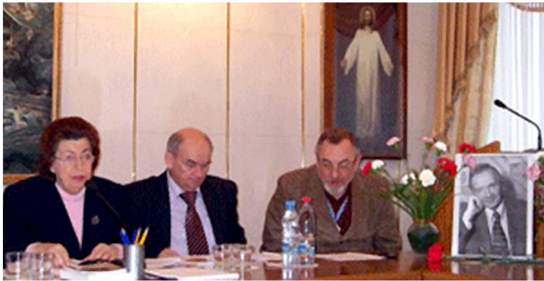
V Панаринские чтения «Духовная и политическая власть» 27 декабря 2007 г., Паломнический центр Московского патриархата

вич ушел из жизни, в Москве проходят ежегодные Панаринские чтения — широко известный форум с международным участием, посвященный изучению научного и аналитического наследия выдающегося ученого, оставившего после себя множество учеников и последователей, заложившего основу самостоятельной научной школы.