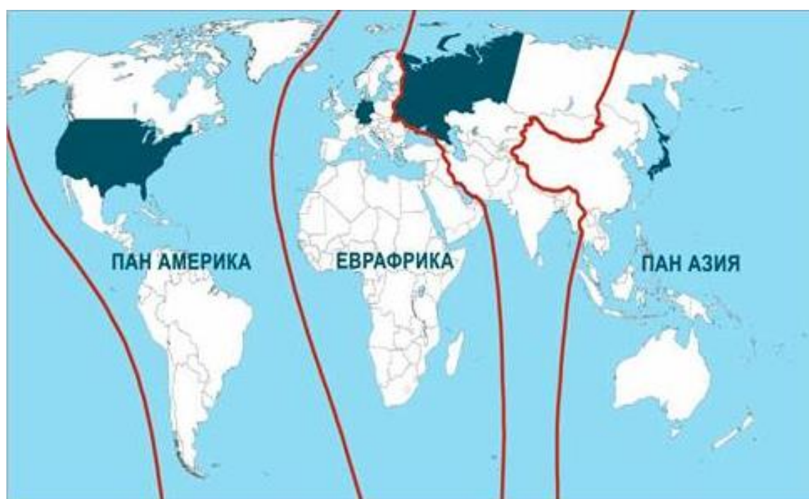
Четырёхчастная модель пан-регионов К. Хаусхофера с пан-Россией между Еврафрикой и пан-Азией.

Теория панрегионализма рисовала такую глобальную геополитическую структуру, которая выражалась бы в объединении государств в регионы по принципу ядро-периферия, исходя из общности социально-политических и экономических проблем. При этом указанные регионы основывались и скреплялись пан-идеями. Пересматривая несколько раз свою панрегионалистскую модель, К. Хаусхофер выделял трёх- и четырёх-региональное деление мира, где четвёртым регионом была пан-Россия с её сферой влияния в Иране, Афганистане и Индостане. Остальные — пан-Азия во главе с Японией (в последствие он объединил этот регион с пан-Россией), пан-Америка во главе с США, пан-Европа или Еврафрика с ядром в Германии.