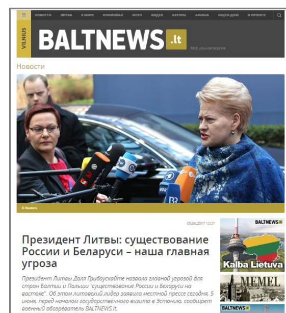
Портал BALTNEWS.lt, 5 июня 2017 г.: перед началом государственного визита в Эстонию «Президент Литвы Даля Грибаускайте назвала главной угрозой для стран Балтии и Польши "существование России и Беларуси на востоке"». С сайта http://baltnews.lt/vilnius_news/20170605/1017216565.html