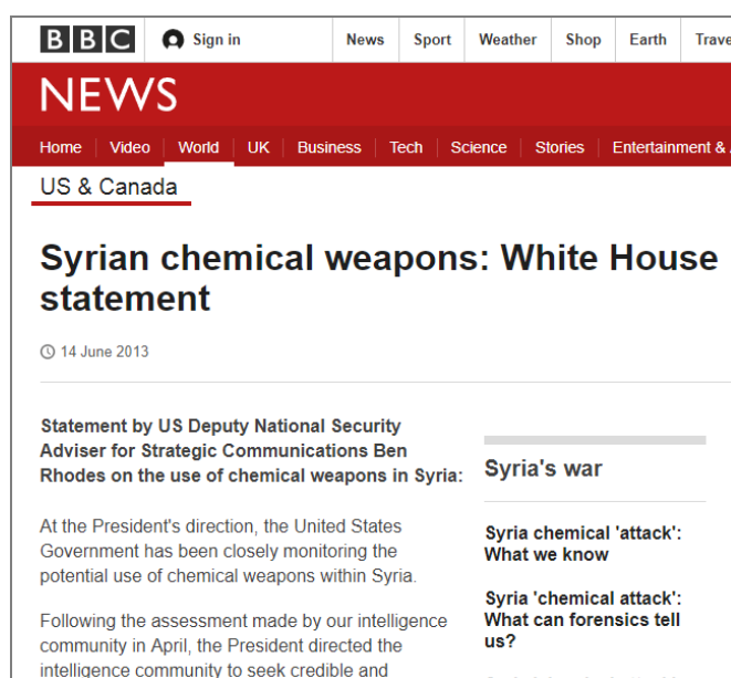
Советник президента США по вопросам национальной безопасности и стратегическим коммуникациям Бен Родс на портале BBC 14 июня 2013 г. о химоружии в Сирии: «Белый дом пришел к выводу, что силы президента Сирии Башара Асада применяли химическое оружие в малых масштабах».