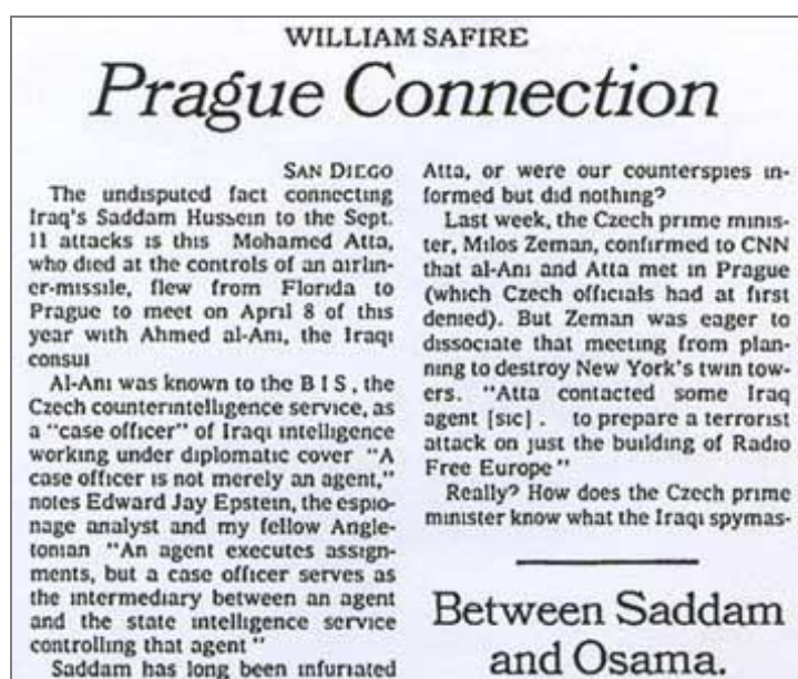
Редакционная статья в New York Times 21 нояб. 2001 г. о связи устроителей теракта 11 сентября с Саддамом Хусейном.