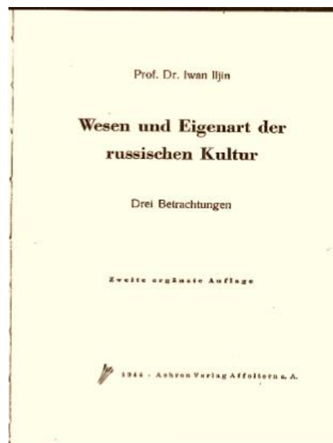
Титульный лист первого издания труда И.А. Ильина Wesen und Eigenart der Russischen Kultur: Drei Betrachtungen («Сущность и своеобразие (особенность) русской культуры. Три соображения», 1944).

Именно так Ильин разграничивает западное и русское сознание.