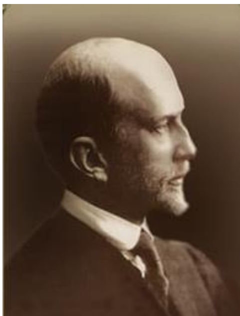
Иван Александрович Ильин (1883—1954).

«...если человек обретает для такой любви предмет, действительно заслуживающий её по своему объективному достоинству, и если этим предметом является духовная жизнь и духовное достояние его народа — то он становится истинным патриотом: он совершает акт духовного самоопределения, которым он отождествляет, в целостном и творческом состоянии души, свою судьбу с духовною судьбой своего народа» [Ильин 1993, с. 25].