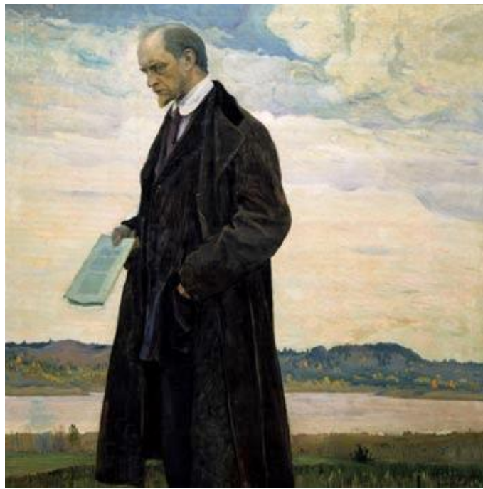
М.В. Нестеров. Философ. Портрет Ивана Александровича Ильина. 1921.

Подводя итоги, необходимо подчеркнуть, что И.А. Ильин в своих произведениях часто указывал на факторы, которые оказывали непосредственное влияние на формирование русской нации. К их числу помимо внешних (таких, как условия жизни, быта, родственные связи, язык, зачастую называемые многими мыслителями со времен Монтескье), философ упоминал и внутренние, к которым относились: способ познания, созерцания, религиозное чувство и др. Ильин отмечает различия между западным и русским менталитетом, усматривая их в религиозной сфере, отличии Восточной и Западной церквей. Имевшие место быть исторические события, связанные с участием народа или проходившие на его территории также, по мнению философа, способствовали выработке уникальных национальных свойств, таких как духовное терпение и щедрость. Особый интерес представляет размышление Ильина о связи национального сознания с исторической формой правления — монархией.